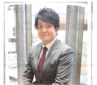
担当ライフプランナー